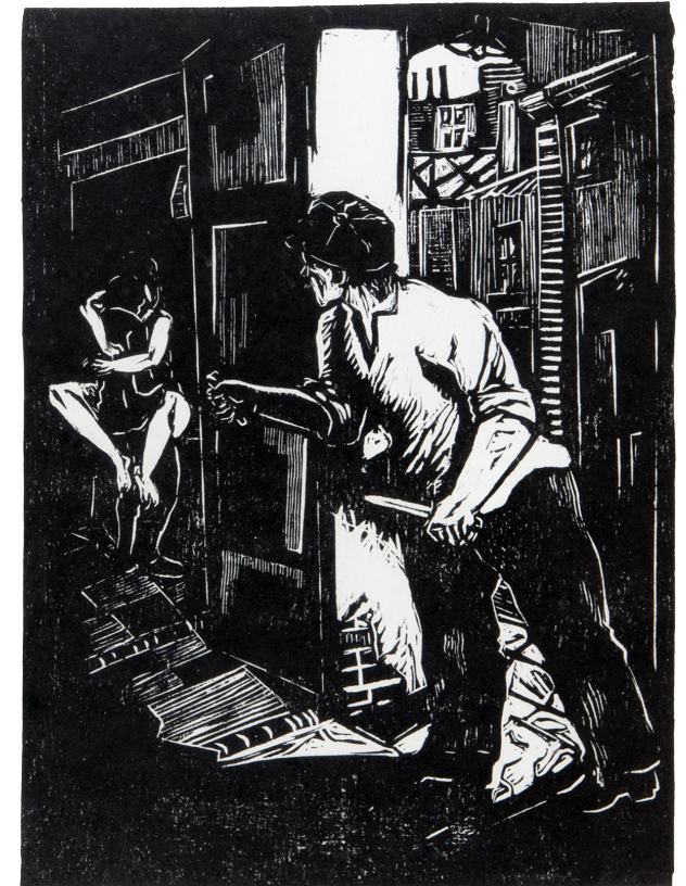
El relumbrón - Héctor Rojas Chaperón