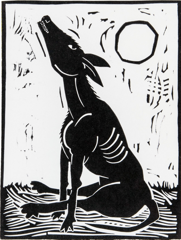
Silbando - Esteban Álvarez