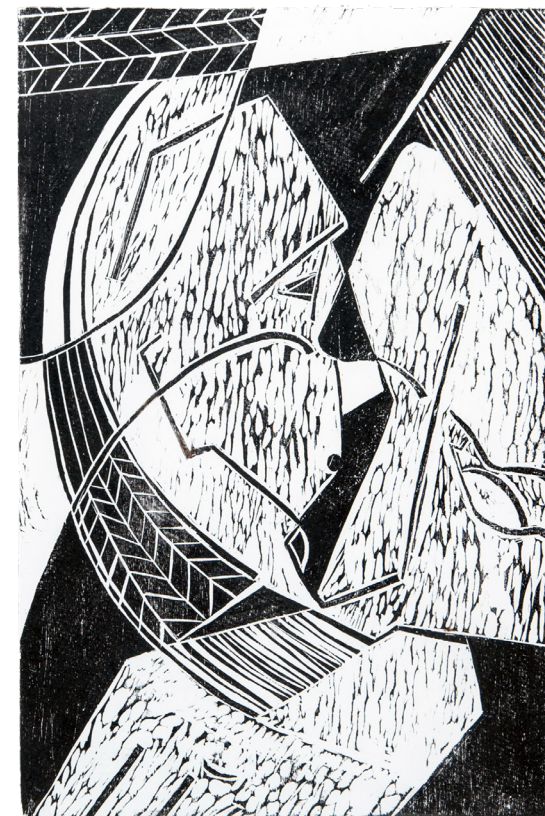
Silbando - Piroaska Catalina Scholz