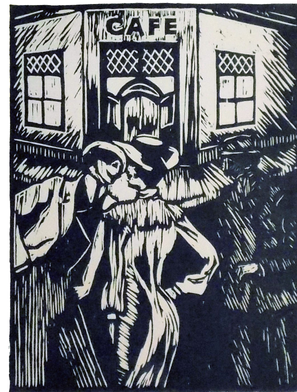
Hablando de amor - Susana Ocampo