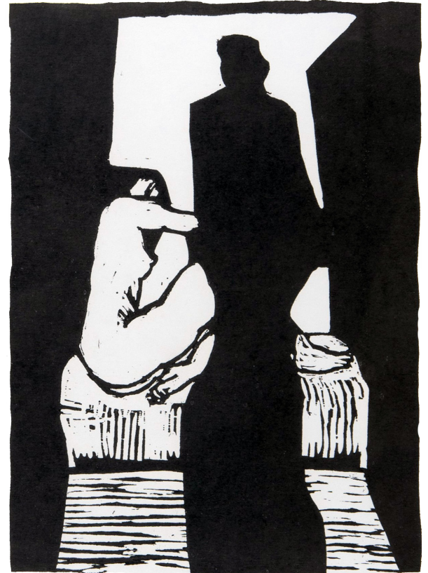
Noche de verano - Carlos Demestre