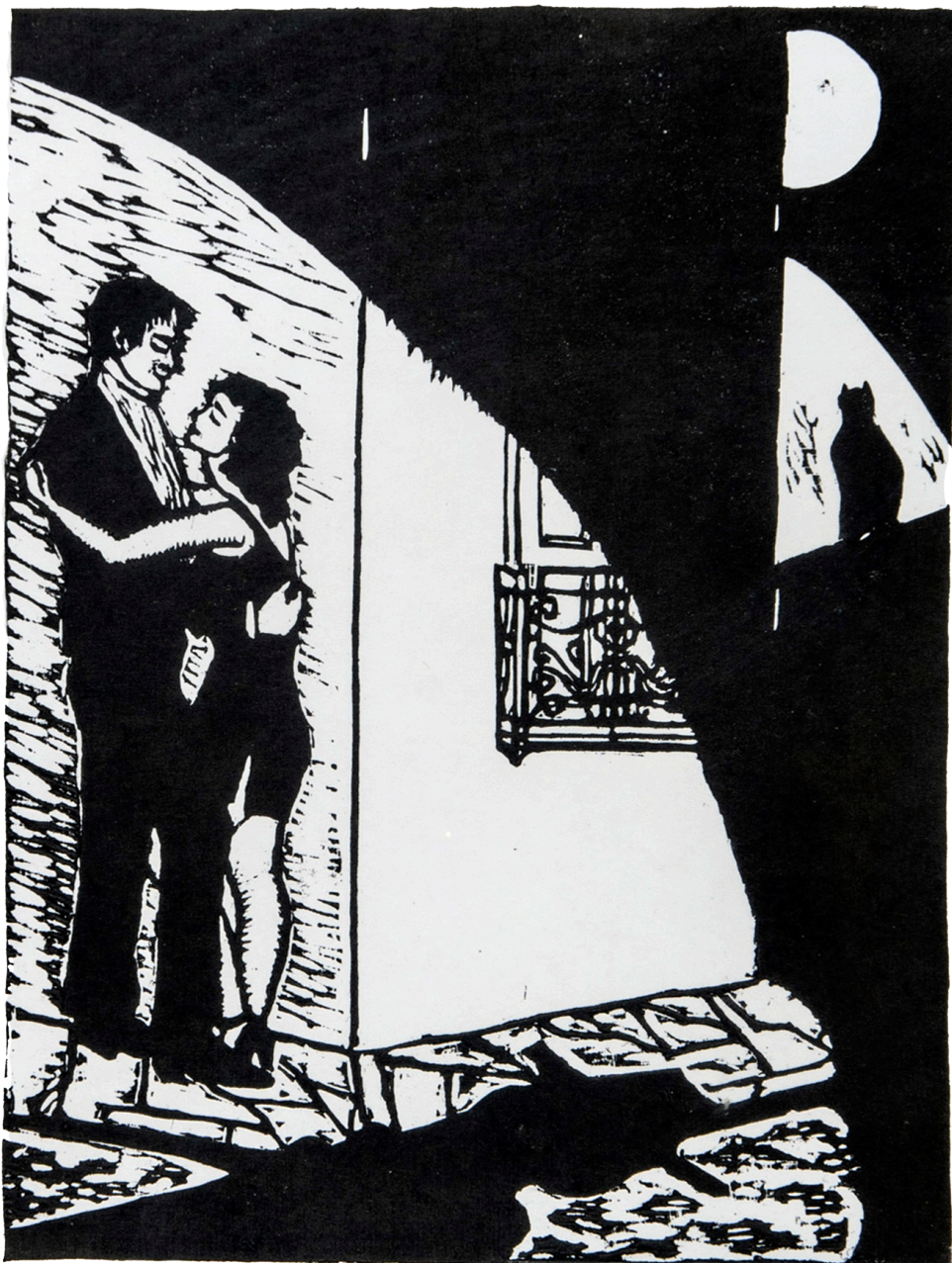
Sombra de hombre - Iris Degregorio