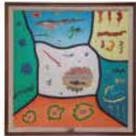
De las Viñetas, de Lido Iacopetti (1936-presente). Acrílico sobre tela de 100x100 cm.