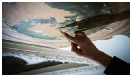
Murales en la escalera del 3er piso, descubiertos por el equipo de restauración durante las intervenciones.